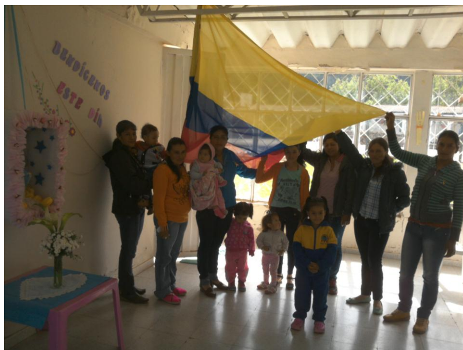
Padres de familia que acompañaron a sus hijos al desarrollo de la actividad 5