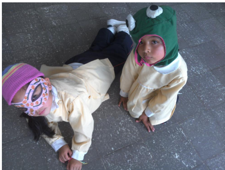
Escena de la obra de teatro. Actividad 5