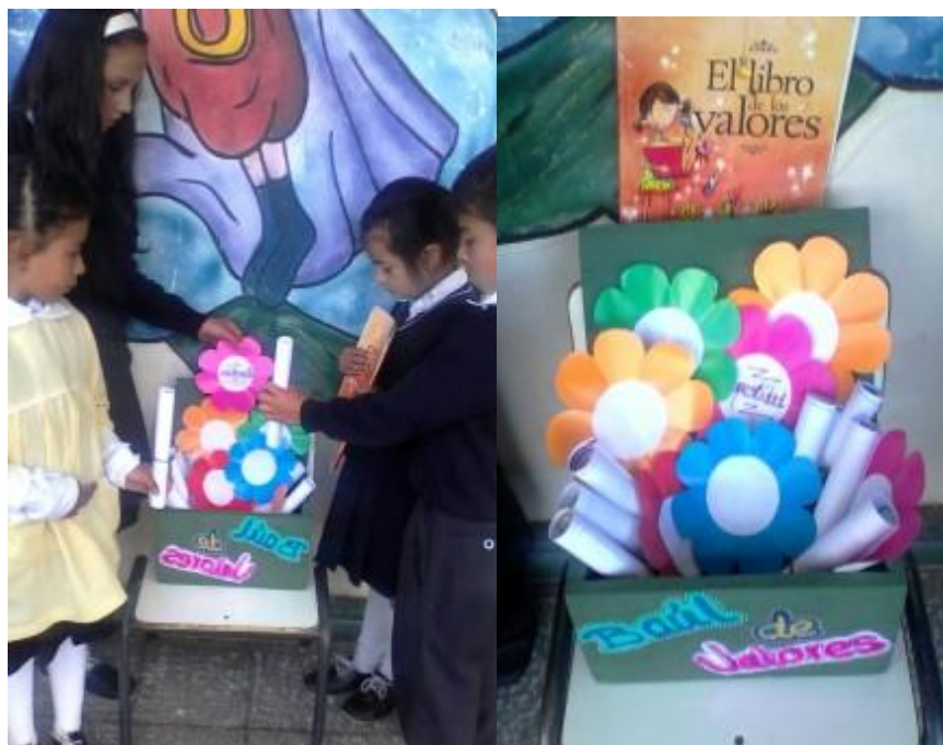
Selección de lecturas del baúl de valores. Actividad 2