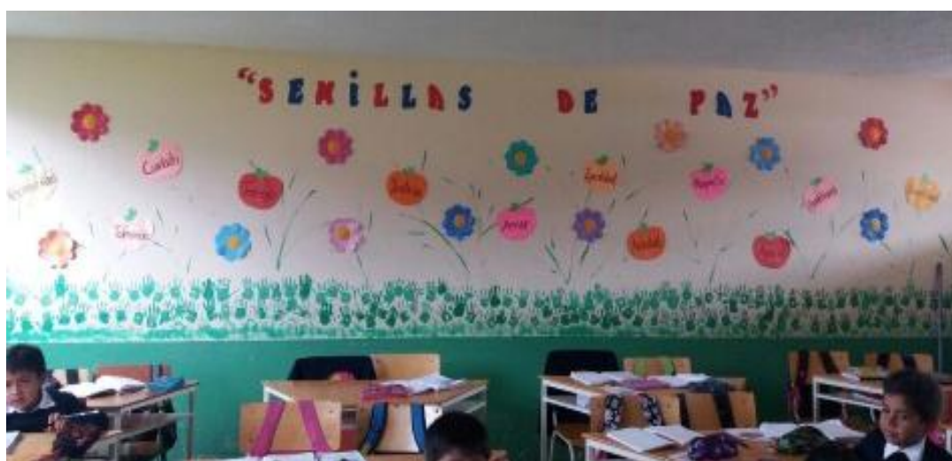
Pendón "Semillas de Valores. Actividad 3