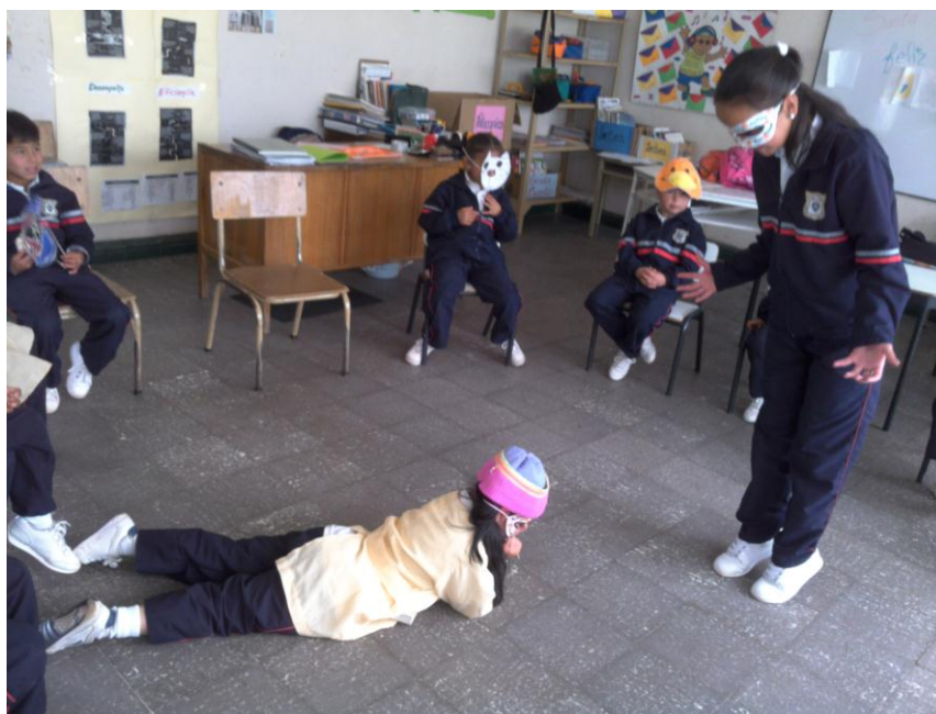
Escena de la obra de teatro. Actividad 5