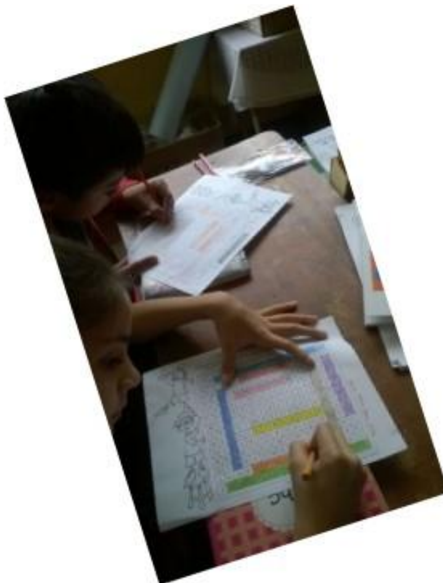
Estudiantes realizando la Sopa de letras. Actividad 1