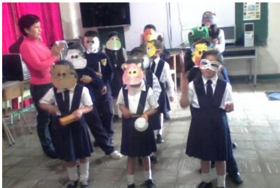
Cantando y divirtiéndose. Actividad 4