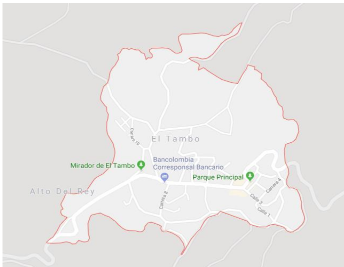
Mapa 1: Municipio de El Tambo. Recuperado en agosto de 2018 de https://www.google.com.co/maps/place/El+Tambo,+Cauca/@2.4526954,-76.8200763,15z/data=!3m1!4b1!4m5!3m4!1s0x8e301f40b6a90d7b:0xa059e9c6243a543a!8m2!3d2.452695!4d-76.811322