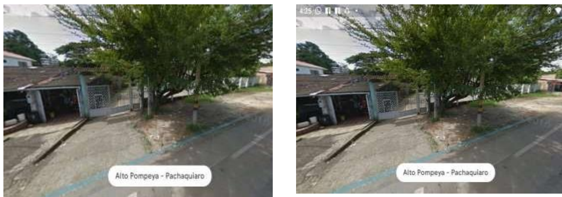
Figura 1 Institución Educativa

Fuente: Google maps (2021). Ubicación geográfica de la Institución educativa Alfonso López Pumarejo de Villavicencio. Obtenido de: https://www.google.com/maps .