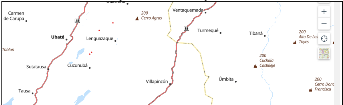
Figura 1. Ubicación Geográfica