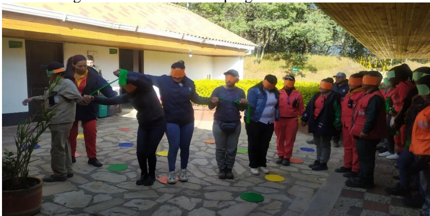
actividad formación