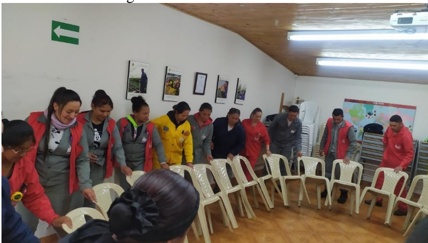
Fuente: Finca Campoalegre, Actividad Formación

En las Figuras 2 y 3 se pueden evidenciar la participación de los líderes de grupo en las actividades propuestas, todo esto realizado después de proporcionar información de los temas de manera teóricos, logrando asociar la teoría, la practica y utilidad de estas de una manera creativa.