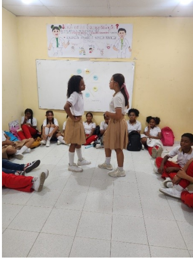
Autor Sandra Zabaleta 2024