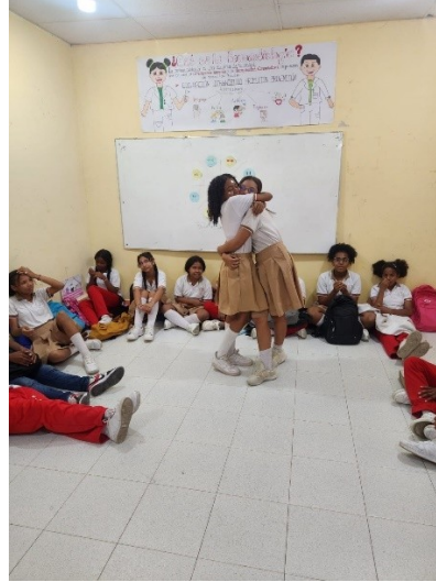
Autor : Sandra Zabaleta 2024

En estas figuras se puede observar el momento en que las niñas expresan sus emociones y se abrazan en un acto de empat