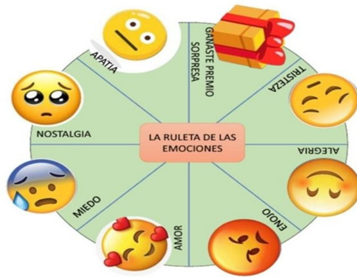
Autor: Jessica Arango Figura de la ruleta escogida por los estudiantes