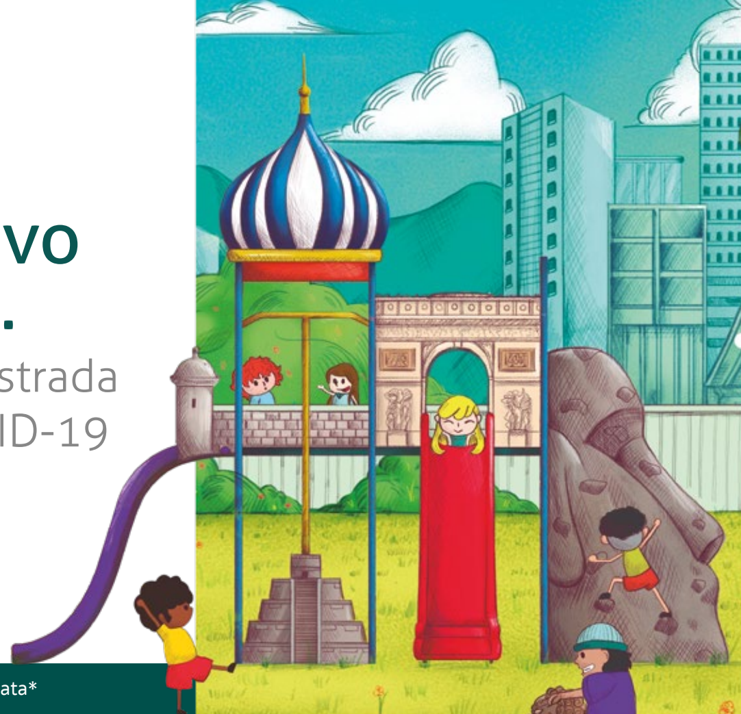
Ilustración digital "Un nuevo mundo" de Pedro Antonio Vidal González

E l presente proyecto surgió en el semillero de Cultura Digital y Videojuegos con el objetivo de participar en la convocatoria pública llamada #IdartesSeMudaATuCasa, creada por el Instituto Distrital de las Artes (Idartes) durante el periodo coyuntural de la cuarentena establecido a causa del COVID-19. Esta invitación tuvo como propósito incentivar la creación de contenidos cortos, “concebidos bajo la idea de Otros mundos posibles, teniendo como premisa el potencial de las artes como un ingrediente que puede ser y estar en la vida cotidiana de las personas” (Idartes, 2020).