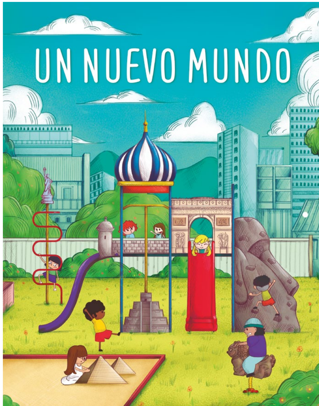
Ilustración digital "Un nuevo mundo" de Pedro Antonio Vidal González