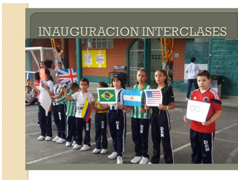
Imagen N° 2. Inauguración Interclases