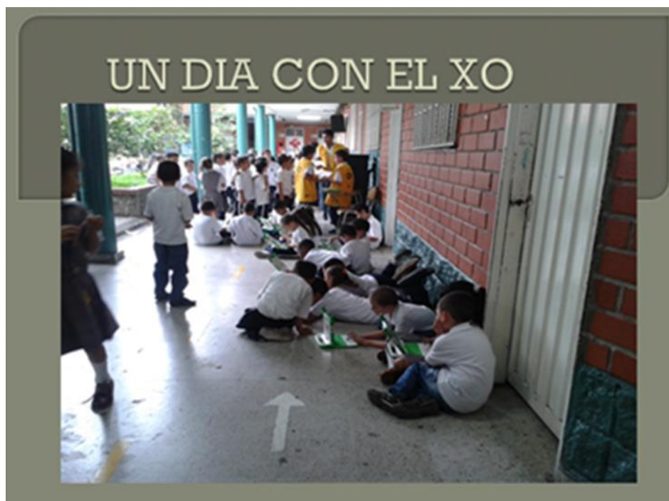
Imagen N° 1. Un día con mi XO

Anexos 4 evidencias de algunas actividades propuestas: