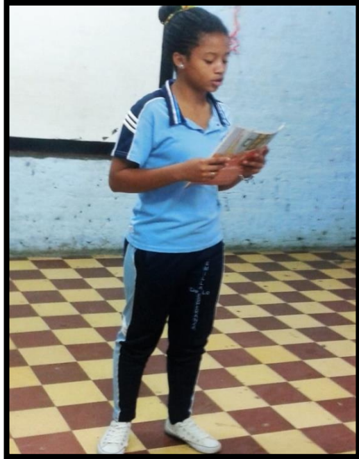
Lectura del cuento. Mi amigo el pintor