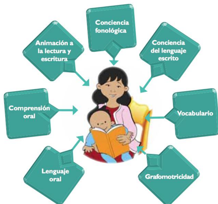
Figura 1 Lectoescritura emergente