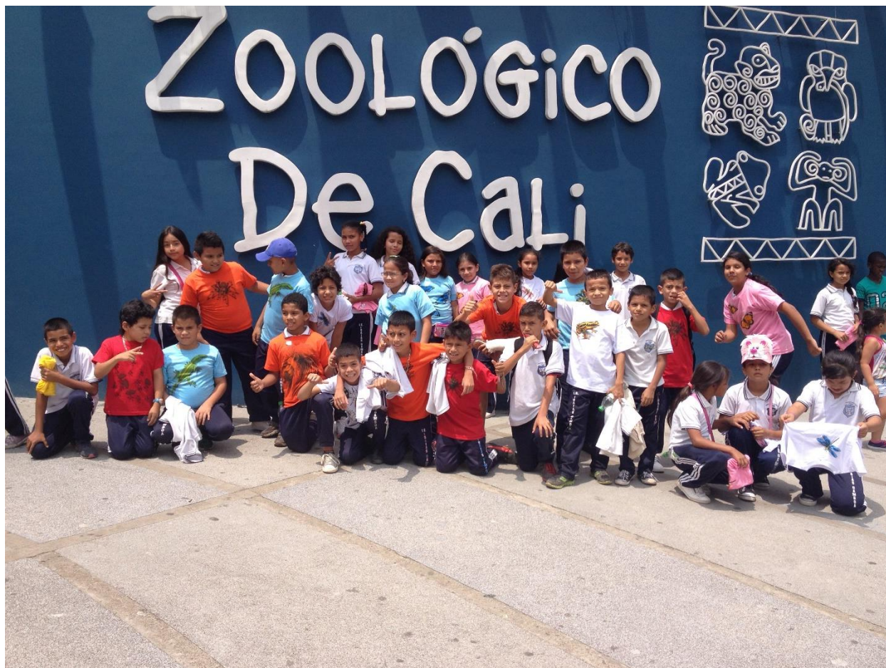
Fotografía 1. Niños y Niñas de Grado Quinto