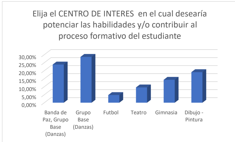
Tabla 2. Propuesta centro de interés