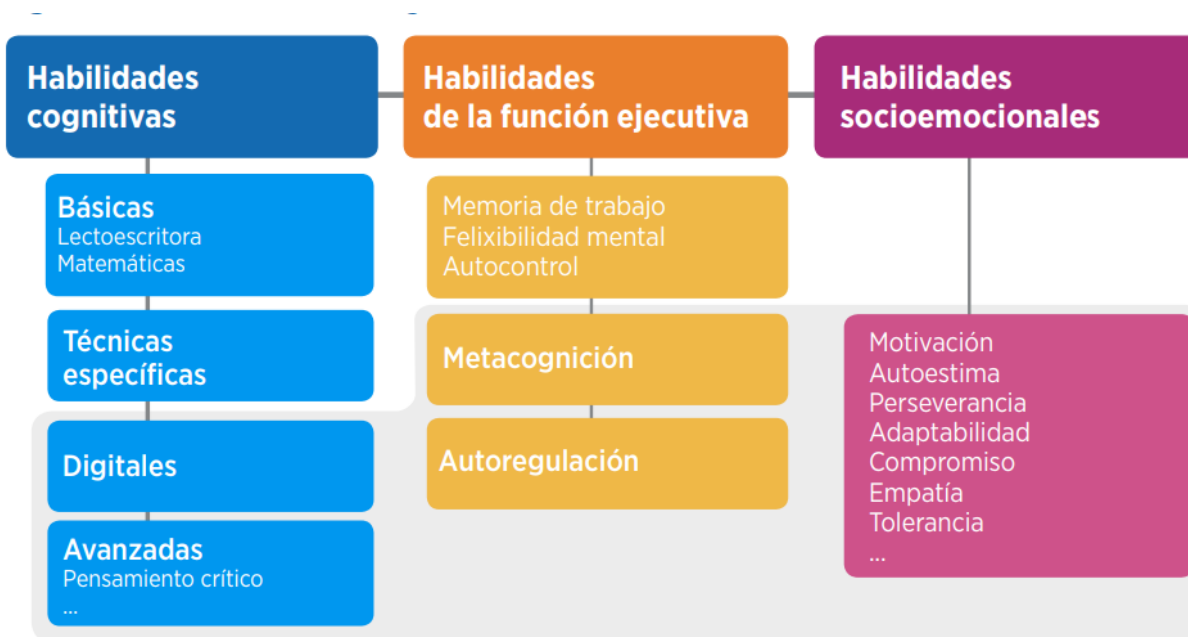
Gráfico 1. Habilidades del siglo XXI