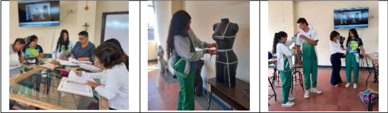
Tabla 4 Evidencias de Implementación

En la tabla 4 se presenta la evidencia fotográfica, la cual da respuesta a los alcances logrados en la implementación según cada una de las temáticas vistas y las actividades propuestas durante el desarrollo de la guía Aprendiendo con Lúdica , soportando la aprobación los resultados de aprendizaje de las 2 unidades diseñadas.