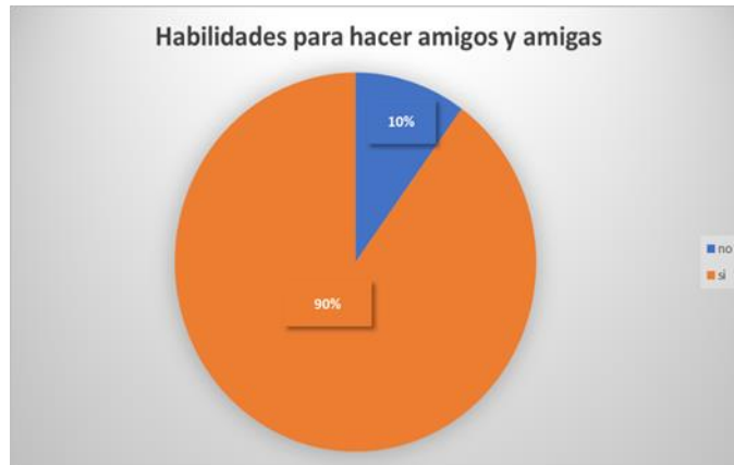
Figura 2. Habilidades para hacer amigos y amigas

La siguiente figura corresponde a los resultados de porcentaje respecto a las habilidades para hacer amigos y amigas del estudiante.