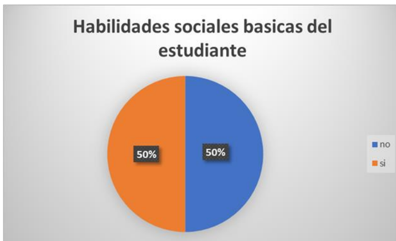
Figura 1. Habilidades sociales básicas del estudiante

La siguiente figura corresponde a los resultados de porcentaje respecto a las habilidades sociales básicas del estudiante.