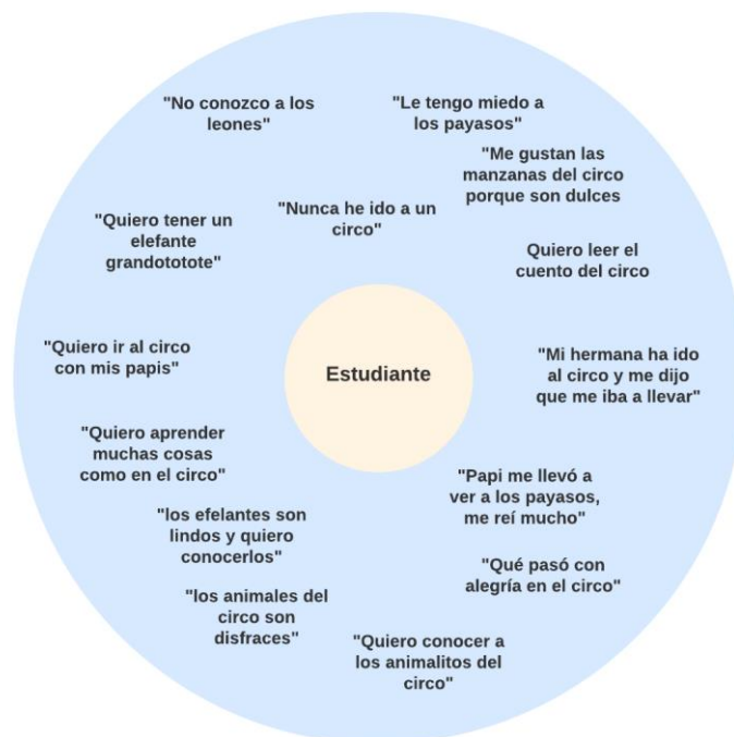
Círculo de percepción de los estudiantes