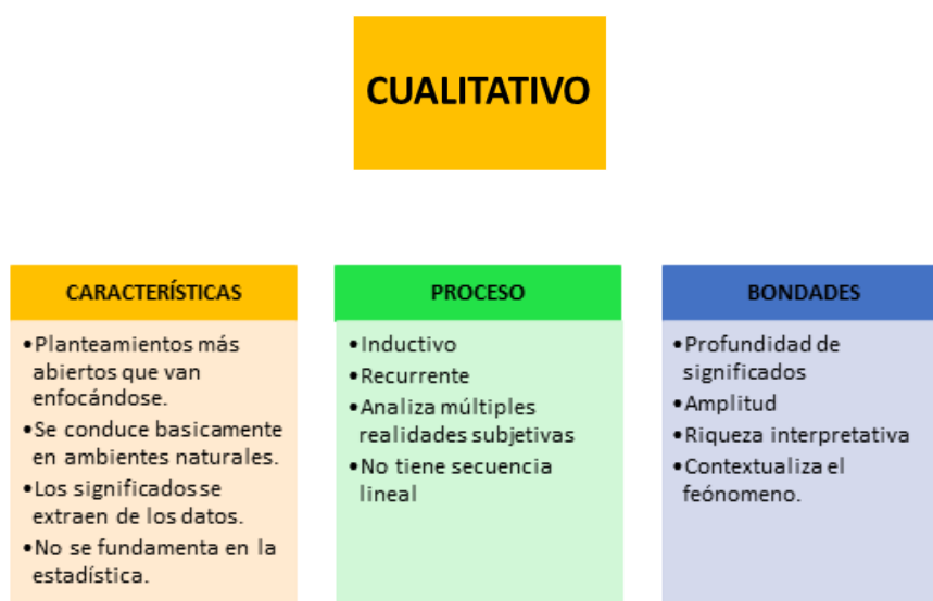
Figura 1. Descripción del enfoque de investigación. Hernández, Fernández & Baptista, (2014).

durante y después de la recolección y el análisis de datos. Este ejercicio sirve para descubrir las preguntas de investigación más relevantes y posteriormente perfeccionarlas y responderlas. El ejercicio de investigación está centralizado en los hechos y su interpretación siendo un proceso circular donde la secuencia no siempre será la misma ya que cada tipo de investigación varia.