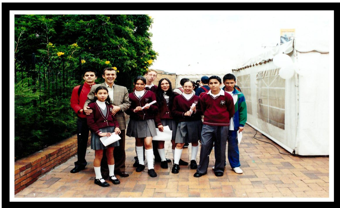
Figura 1. Integrantes de la emisora escolar, 2004. IED Ciudad de Bogotá