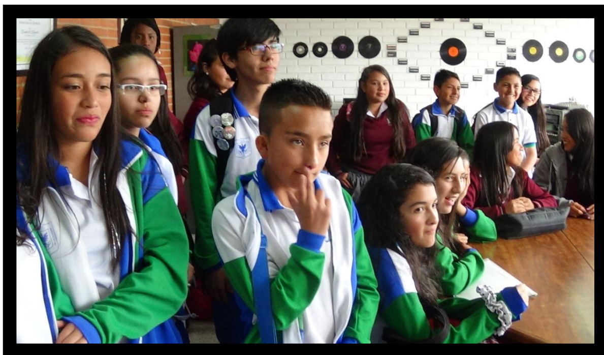
Figura 8. Emisora escolar. IED Ciudad de Bogotá.