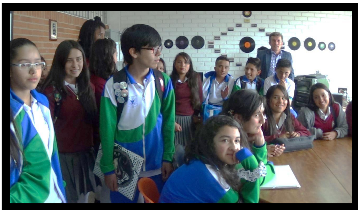
Figura 6. Alumnos activos actualmente en la emisora escolar. IED Cuidad de Bogotá.