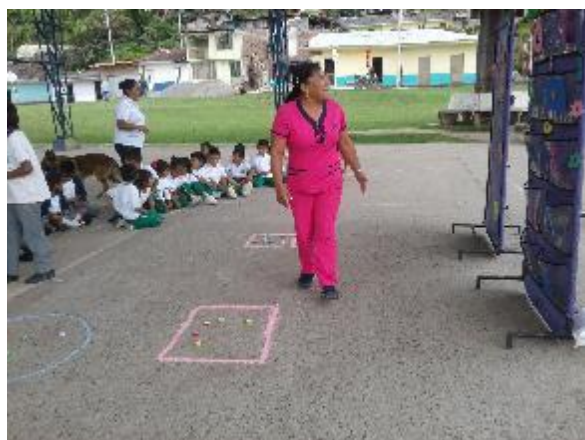
Explicación de las actividades.