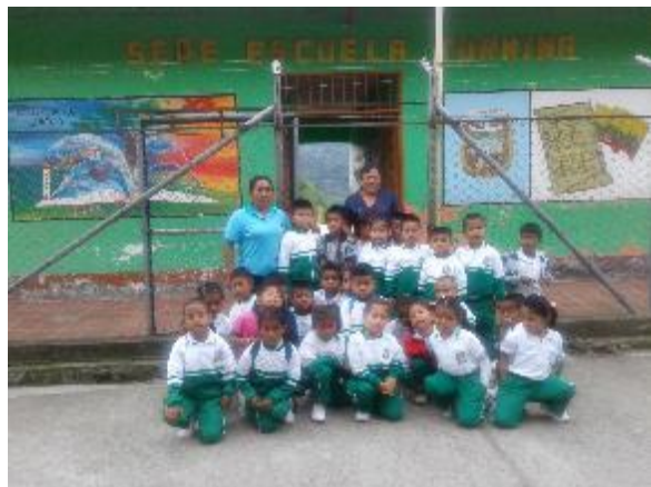
Estudiantes de preescolar 2018

Para la observación es importante llevar una bitácora; es decir, un diario donde se consigne teniendo en cuenta el día y la hora del suceso importante al cual se está observando y nos sirva para el enriquecimiento de la investigación. Igualmente se requiere de algunas entrevistas para conocer y compartir algunas ideas e inquietudes de parte de los padres de familia especialmente y compañeros docentes.