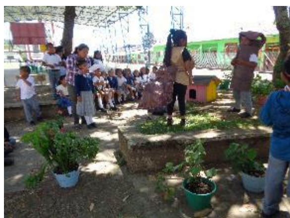
Realización de escenografía lúdica.