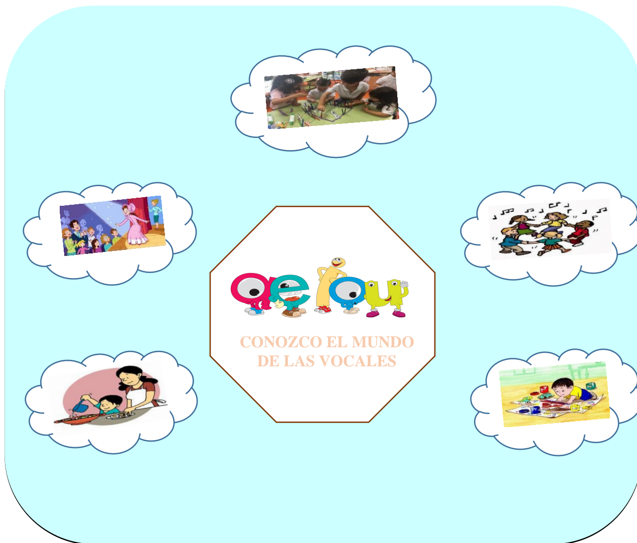
Imagen 7. Conozco el mundo de las vocales.