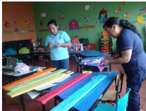
Preparación de material para las actividades.