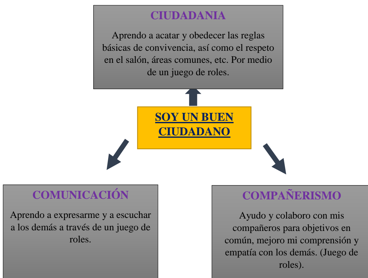
Figura 4. Estrategia lúdica Soy un buen ciudadano

ítem; el correcto comportamiento y los valores que deben ser resaltados en áreas comunes de la institución será el objetivo principal de las actividades presentadas. Acrecentar y fortalecer el trabajo en equipo será indispensable para que se tenga un aprendizaje colaborativo y así mismo se pueda comprender la importancia de la autorreflexión por parte de los estudiantes y saber en qué nivel valórico se encuentran, mejorando la comprensión y empatía con los demás. (Ver cuadro representativo a continuación.)