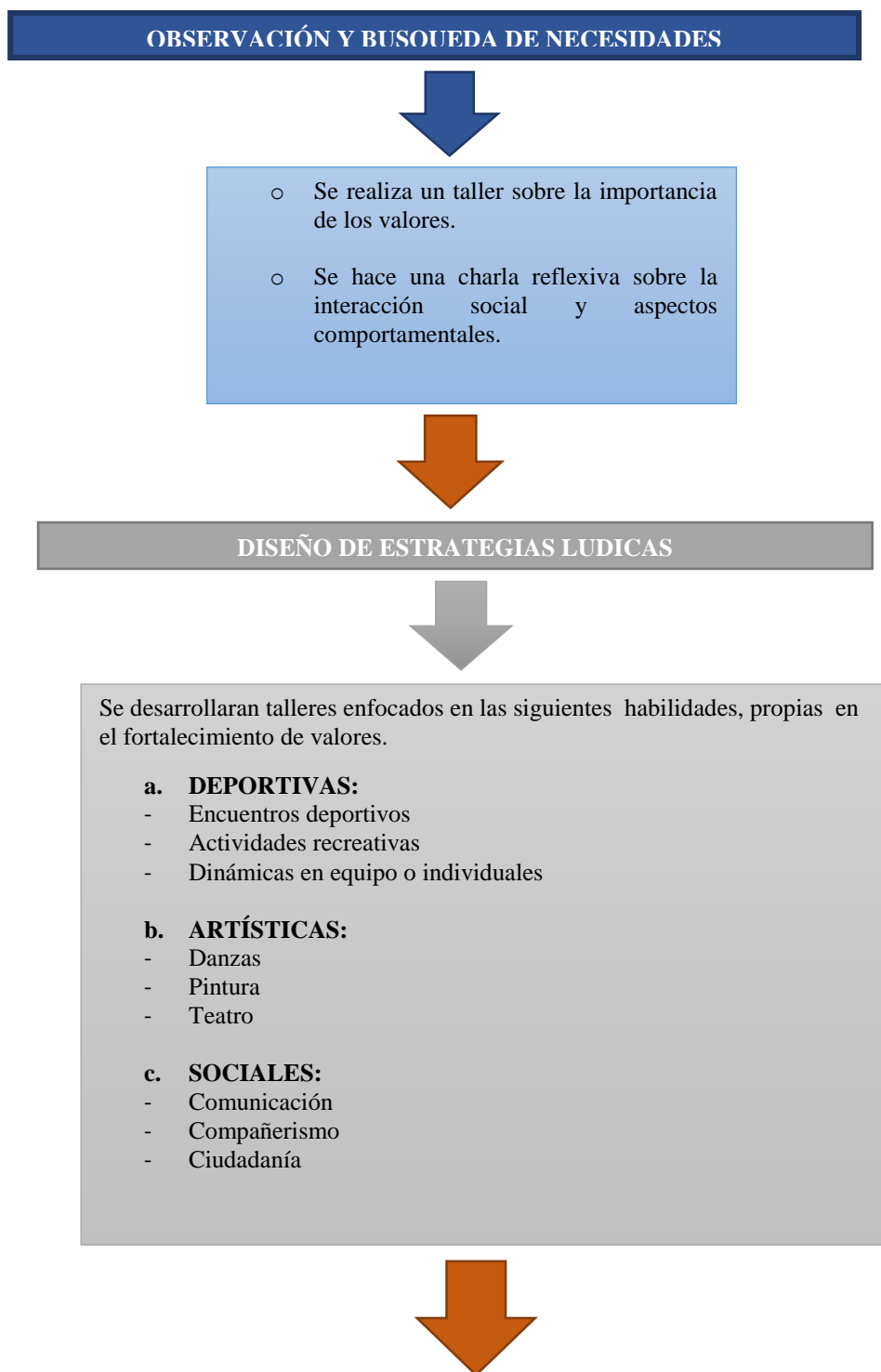
Figura 1. Momentos de la intervención lúdica