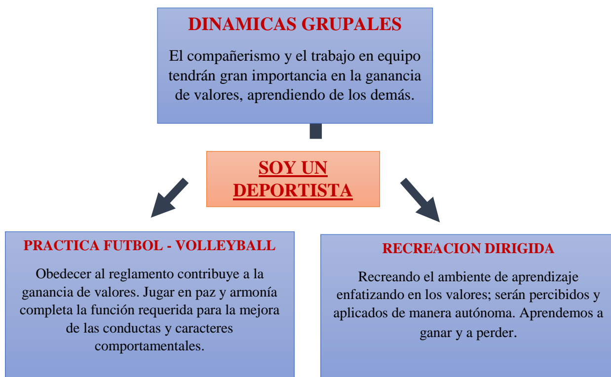
Figura 2. Estrategia lúdica Soy un deportista

través de actividades recreativas que tengan como finalidad el afianzamiento de los valores que generen comprensión de los mismos y se comiencen a aplicar en los diferentes entornos donde se desarrollan los estudiantes. (Ver cuadro representativo a continuación.)