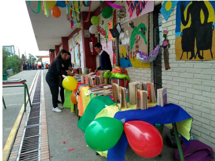
Imagen 6. Feria Del Libro