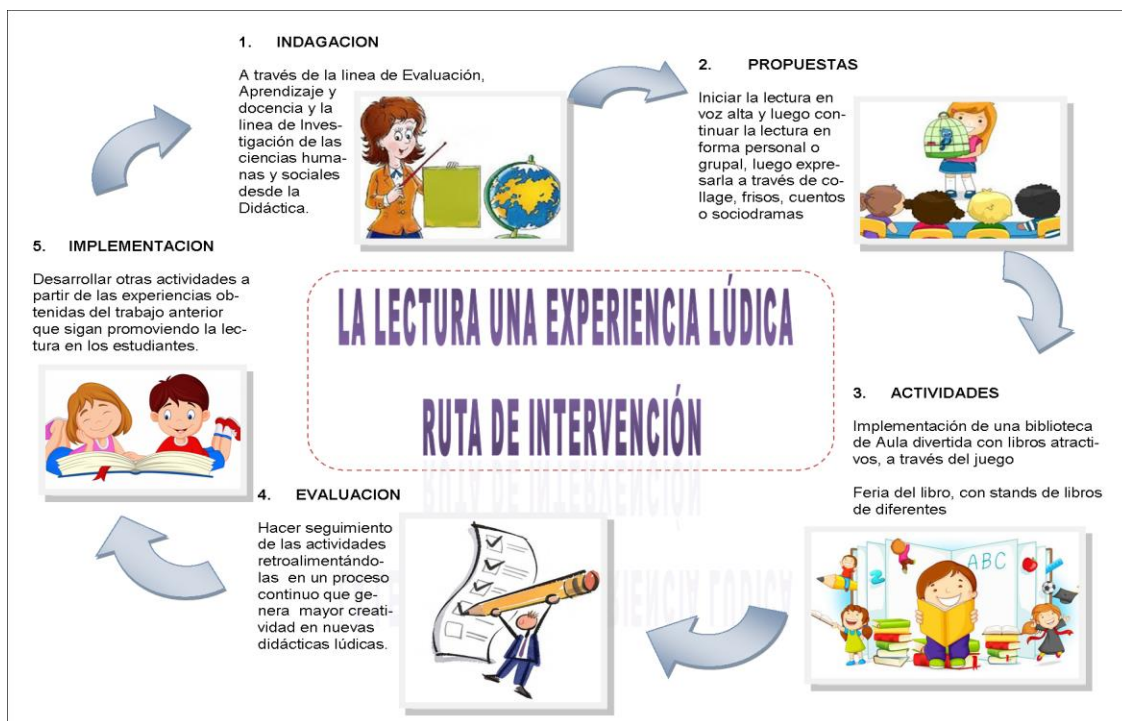
Imagen 3. Fases De La Propuesta De Investigación

Nuestra propuesta de intervención está desarrollada en cinco momentos a saber: indagación, propuestas, actividades, implementación y evaluación. En este orden de ideas planteamos el siguiente esquema: