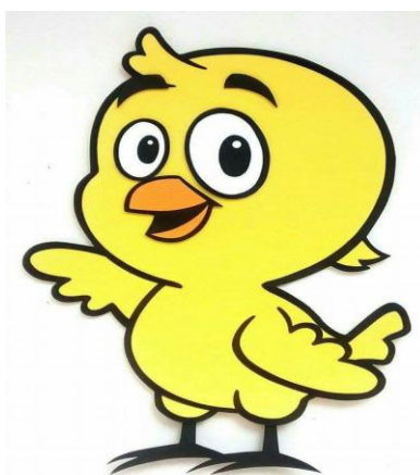
Figura 6. Pollito amarillito