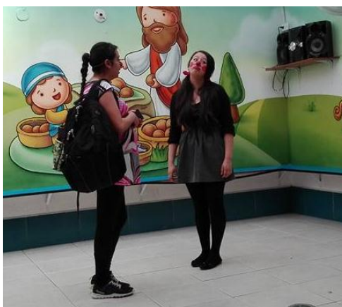
Figura 3. Dramatización inclusión

No 1: Por medio de cuentos, títeres, videos, dramatizaciones, charlas y juegos realizamos actividades de sensibilización a los niños, niñas y docentes para que conozcan las diversas características de la condición del síndrome de Down, y la inclusión escolar.