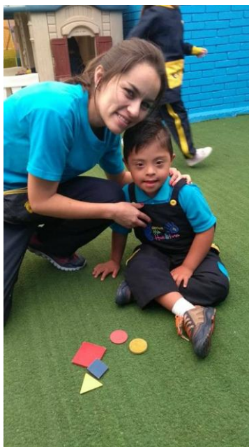
Figura 11 Reconocimiento de figuras Geométricas

y del mismo color. Aquí reconocerá diversas figuras por sus tamaño, color y grosor, teniendo en cuenta su seriación.