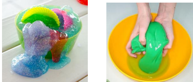
Figura 12. Slime