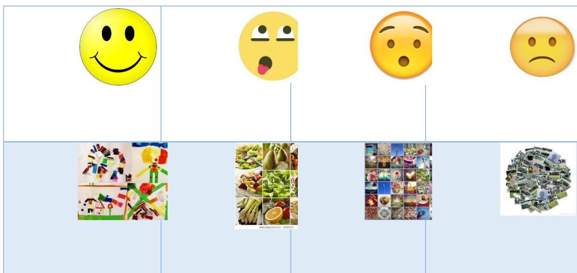
Tabla 3. Cartel de experiencias