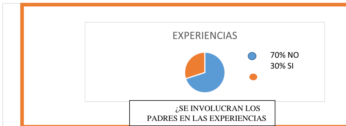
Figura 1. Porcentaje de padres que se involucra en las experiencias escolares de los niños y niñas

Participación de los padres en las experiencias escolares desde la casa.