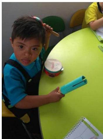
Figura 9 identificando instrumentos instrumentos con