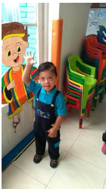
Figura 7. Bailando