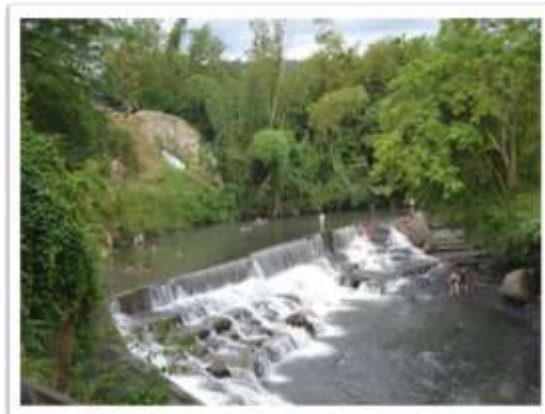
Figura 5. Boca toma Rio Villeta.

Hidrográficamente el Municipio de Villeta se encuentra ubicado en la cuenca alta del Río Negro, a la cual pertenecen la subcuenca del río Tobia y la del Río Villeta que comprende las micro cuencas de las quebradas Maní, Acatá, Cantarrana, El Cojo y Guanábana; la micro cuenca de la quebrada Grande o Curazao en la vereda Hiló Grande, la micro cuenca del Río Dulce, la micro cuenca del Río Namay, la micro cuenca de la quebrada la mugrosa, la micro cuenca de la quebrada Santibáñez con todos sus afluentes, la micro cuenca de la Quebrada La Masata y la