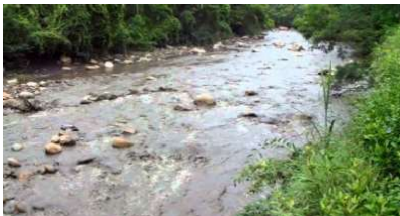
Figura 3. Río Apulo del municipio de la Mesa (Cundinamarca)

El río Apulo se encuentra ubicado en la Inspección de San Joaquín perteneciente al municipio de la Mesa, Provincia del Tequendama, departamento de Cundinamarca. Ocupa una extensa área que se distingue por estar cultivada especialmente de mango, producto que la hace famosa en la región por las variedades que se cultivan en grandes cantidades. Distanciada de la