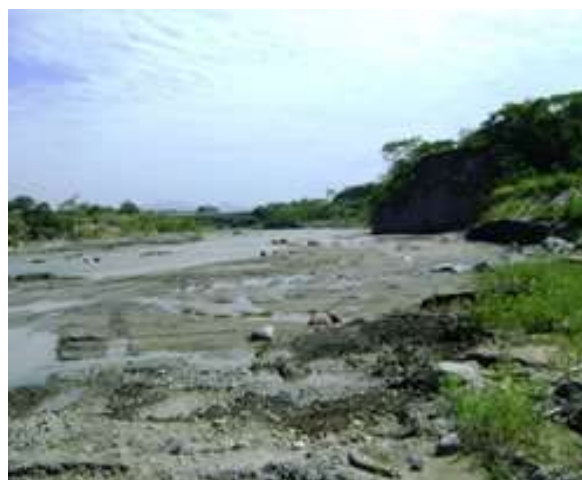
Figura. 6. Rio Coello Figura. 7.

Este rio lo ubicamos en el departamento del Tolima, específicamente en su capital Ibagué, barrio San Isidro perteneciente a la comuna 13. Por este sector cruza el rio Coello, uno de los afluentes del rio magdalena de más tradición en el departamento, por ser una fuente de progreso para los municipios asentados en sus riberas. Nace en las cumbres del nevado del