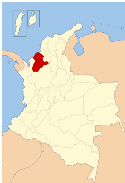
Figura 1. Ubicación del departamento de Córdoba