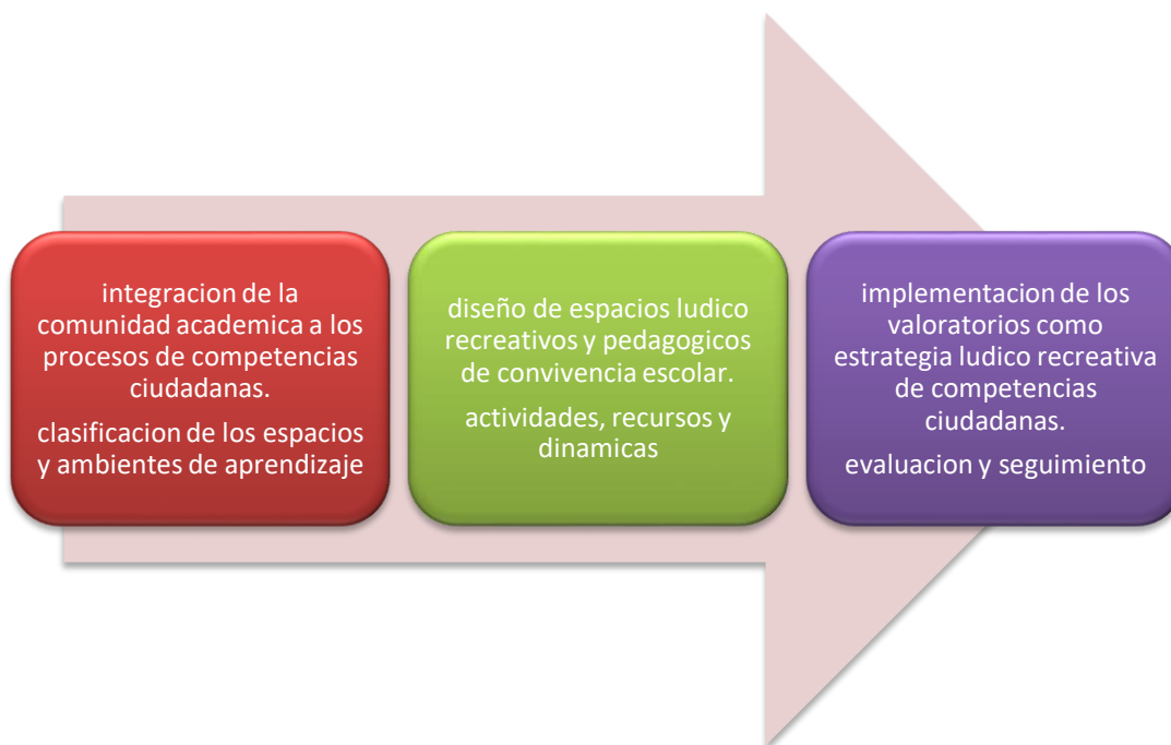
Figura 4. Propuesta de intervención ludico-pedagogica