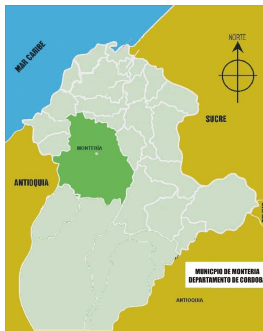
Figura 2. Ubicación del Municipio de Montería