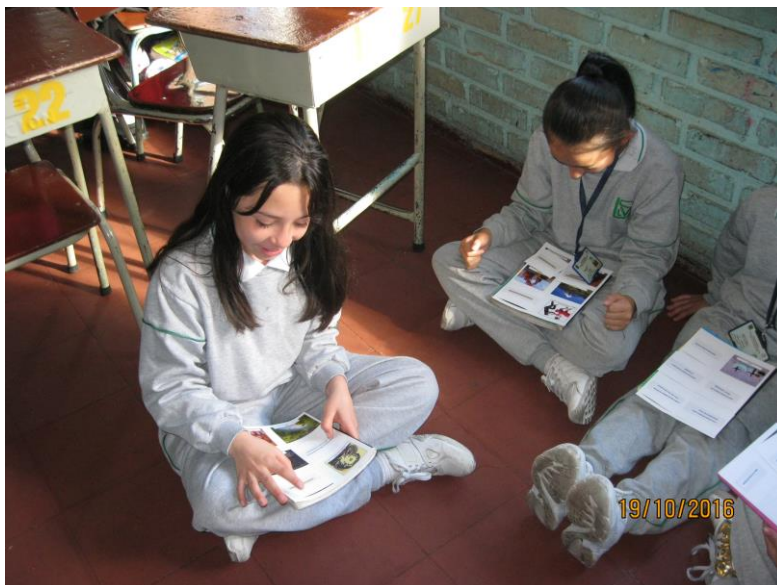
Figura 5. Desarrollo del juego de lotería.