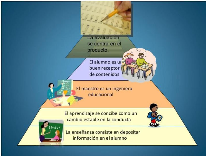
Figura 2. El conductismo en la educación

un estudiante es visto como el historial de refuerzos que dicho comportamiento ha recibido. Como para los conductistas el aprendizaje es una manera de modificar el comportamiento, los maestros deben de proveer a los estudiantes con un ambiente adecuado para el refuerzo de las conductas deseadas” (p.19).