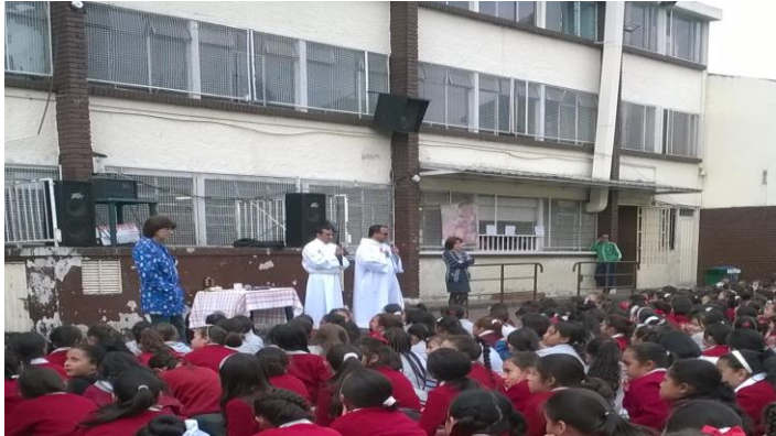
Figura 1. Colegio Femenino Lorencita Villegas de Santos I.E.D