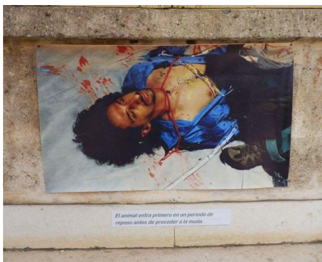
El animal entra primero en un periodo de reposo antes de proceder a la muda.

En el performance se cambia el estar por el ser ; ese estado no es transitorio, es decir que el cuerpo no es un medio, es un cuerpo que siempre estuvo ahí, habla de destruir preconceptos modificando estructuras del lenguaje y el discurso, mecanismos de representación, que dan estrategias para reconocer las propias fragmentaciones.