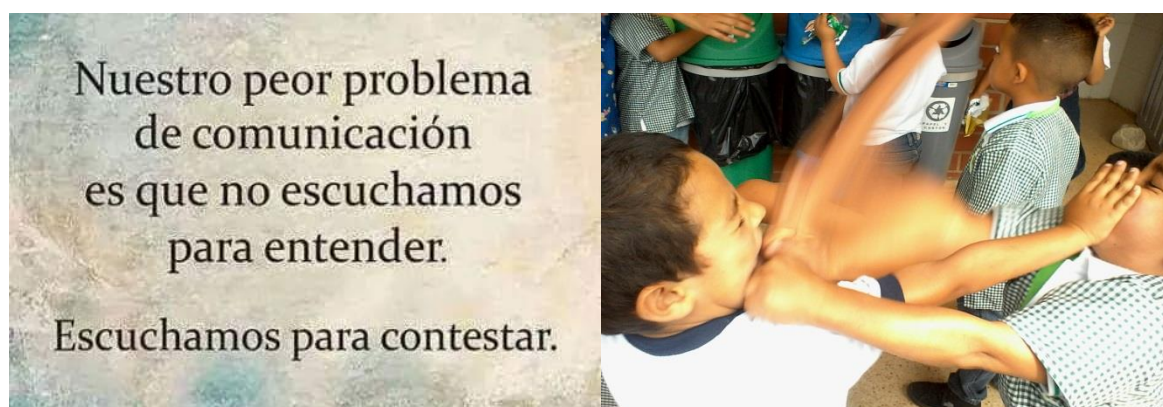
Fotografía 6. Escuchamos para contestar

Nuestra propuesta de intervención pedagógica, consiste en llevar las expresiones lúdicas al aula de clase de los estudiantes de preescolar y cuarto de primaria del CETEM (Centro Educativo Travesías El Morro), estará encaminada al fortalecimiento de valores que conlleven a mejorar sus relaciones de convivencia, a disminuir comportamientos agresivos entre pares, tales como los observados en la siguiente ilustración: