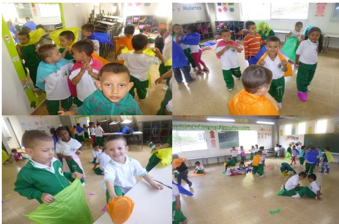
Fotografía 3. Expresión Lúdica – Lenguaje Escénico

“como si ...”, es decir disfrazarnos como si este papel fuera algo que nos ayuda a adornar o a vestir nuestro cuerpo...Entra aquí la manifestación creativa de los estudiantes cuando HACEN (crean y recrean) capas, faldas, delantales, pulseras, aretes, collares y lo disfrutan observándose frente al espejo.