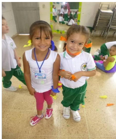
Fotografía 1. Jugando y transformando

Nombre de la actividad: Jugando y transformando, con lo que tengo voy gozando! (Taller con papel globo, para niños y niñas de preescolar).