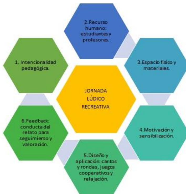
Figura 2. Esquema de Jornada lúdico-recreativa.