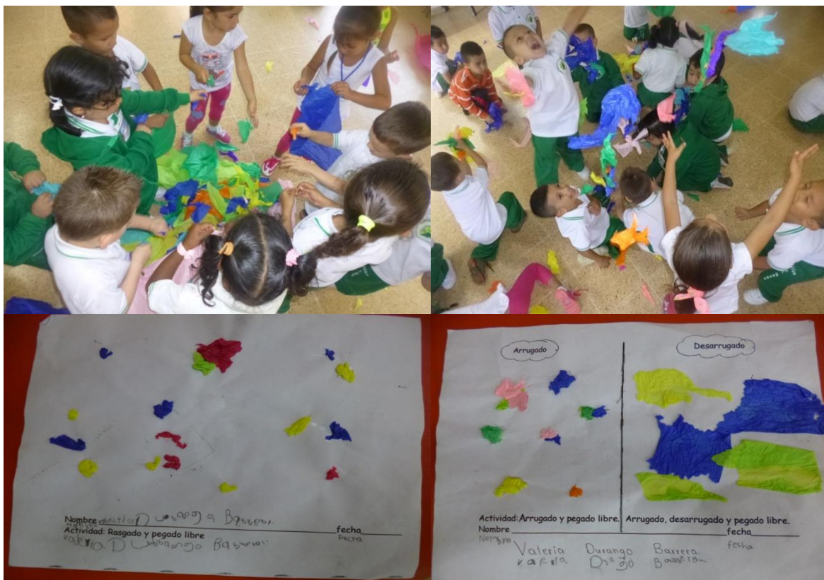
Fotografía 4. Planchar con las manos