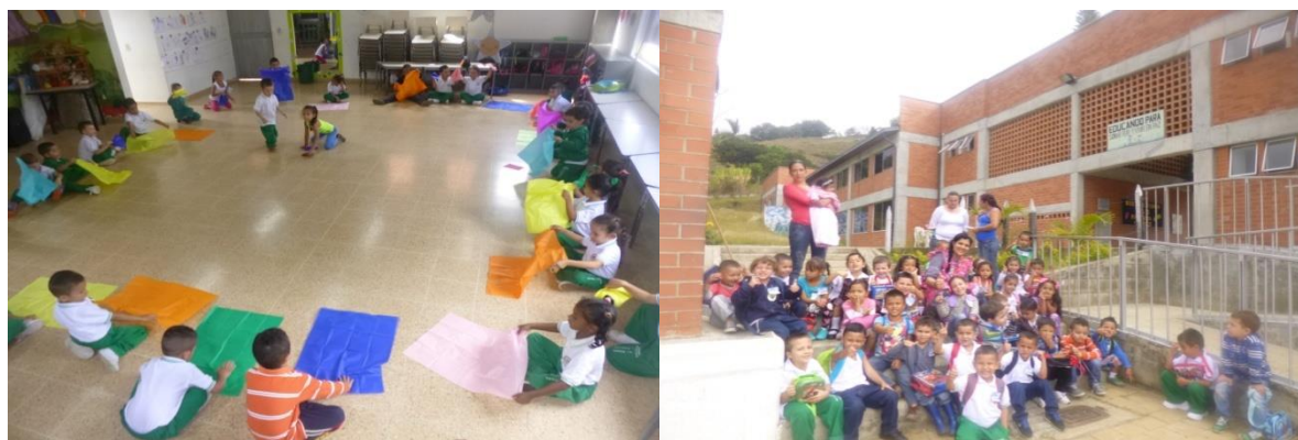
Fotografía 2. Trabajo directo con los niños y niñas

Se comenta al grupo que la sorpresa del día está dentro del aula de clase. Al entrar, los niños encuentran en el piso un círculo formado con pliegos de papeles de colores. Cada estudiante se ubica frente al color de su predilección, pues es su regalo (un pliego para cada uno= correspondencia término a término o biunívoca, esto da cuenta de la transversalización la actividad).