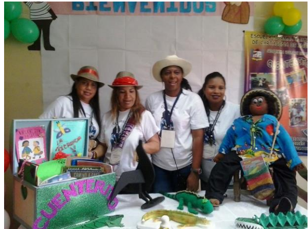
Trabajo en el aula de cuentería y tradición oral