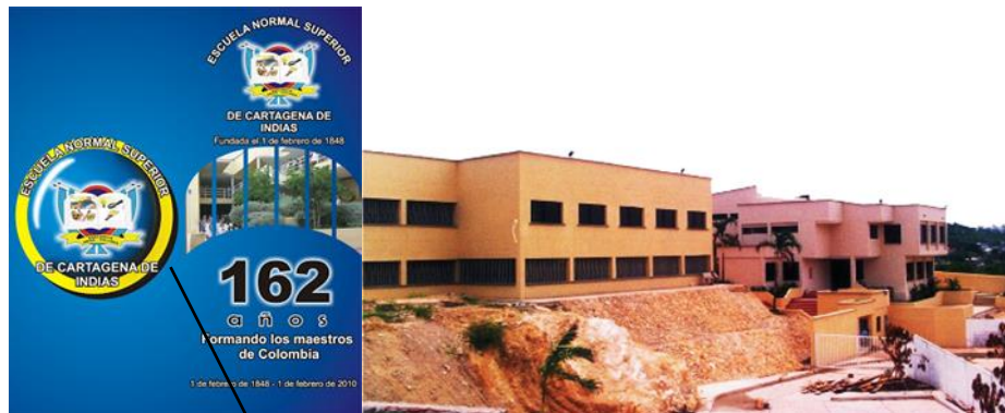
Gráfico 1. Ubicación de la Escuela Normal Superior en Cartagena de indias

formación de los maestros de preescolar y básica primaria, efectivos e idóneos, que requieren tanto el Distrito de Cartagena como su amplia zona de influencia.