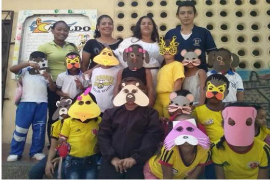
Dramatizado Arca de Noé