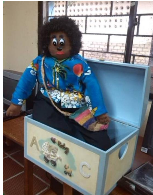
Cuenterito personaje de la propuesta