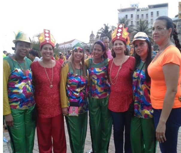
Puesta en escena cabildo