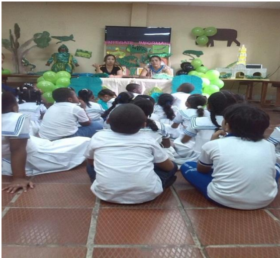
Conversatorio plan lector