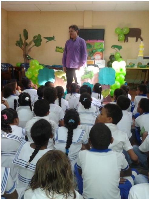
Visita Gustavo Tatis Escritor cartagenero.