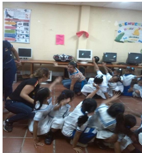
juegos y rondas tradicionales