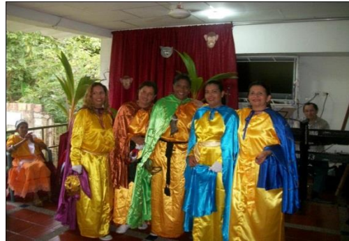
Proyección social visita asilo la milagrosa