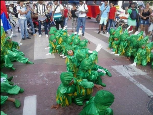
Danza el gusano.