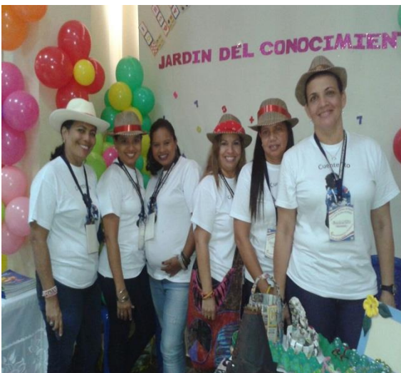
Feria del conocimiento