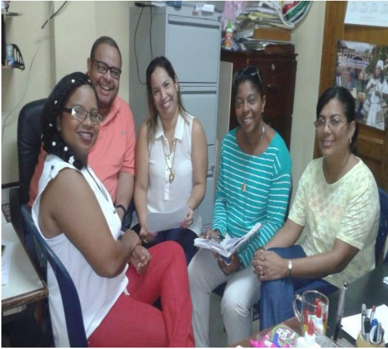
Entrevista a un integrante del comité cabildo