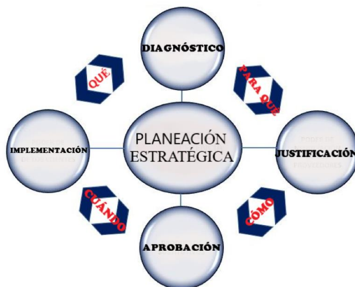
Gráfica N°2. Planeación estratégica

El teatro es una base fundamental para el proceso con los estudiantes y se tendrá en cuenta en este momento como lo menciona Álvarez: “este ejercicio es pertinente porque busca explorar las relaciones, vínculos y posibilidades del arte como lenguaje para la gestión con comunidades” (2016, p.10).