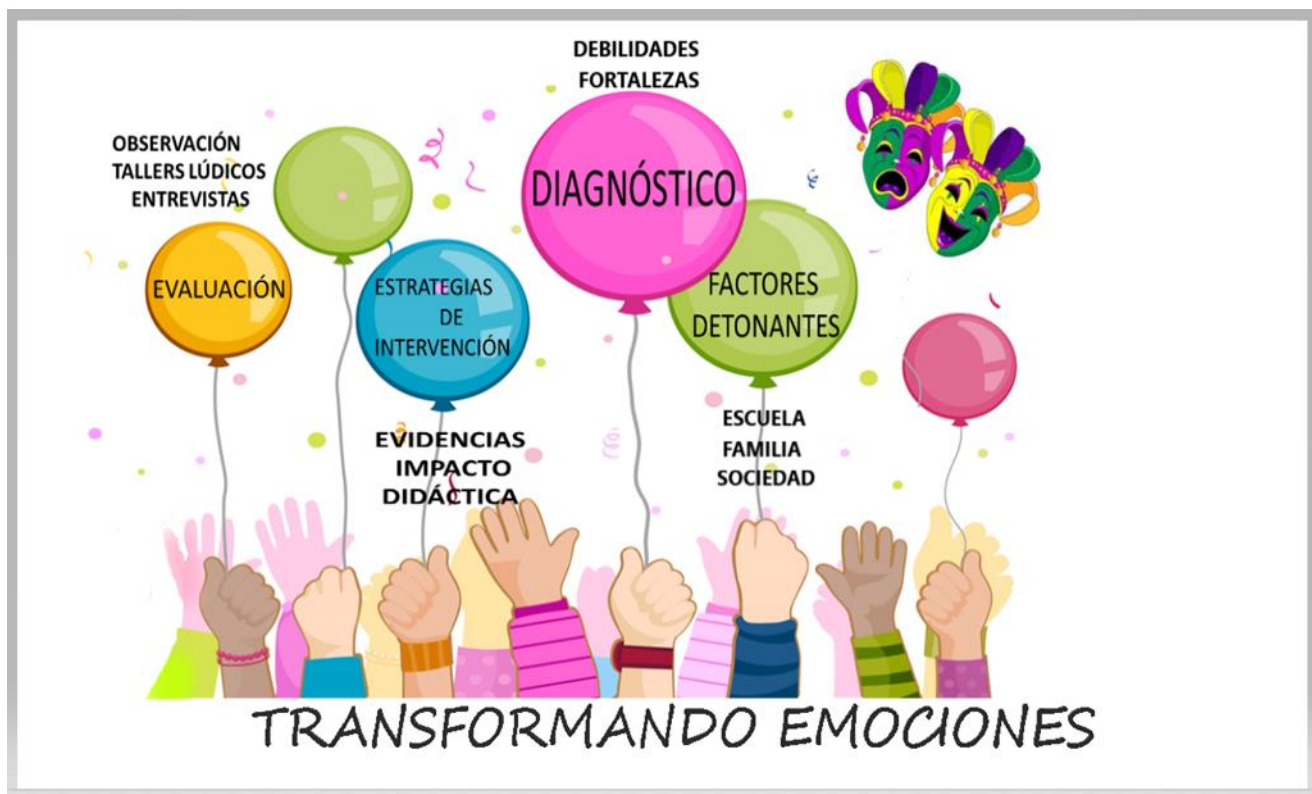
Gráfica N°1. Ruta de intervención

La siguiente ruta de intervención estratégica es la carta de navegación para llevar a buen término el PID y se muestra a través del siguiente proceso dinámico: