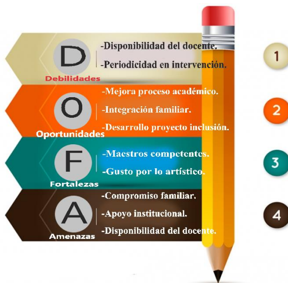
Gráfica N°3. Matriz DOFA

Seguidamente se muestra un supuesto visibilizado desde la matriz DOFA.